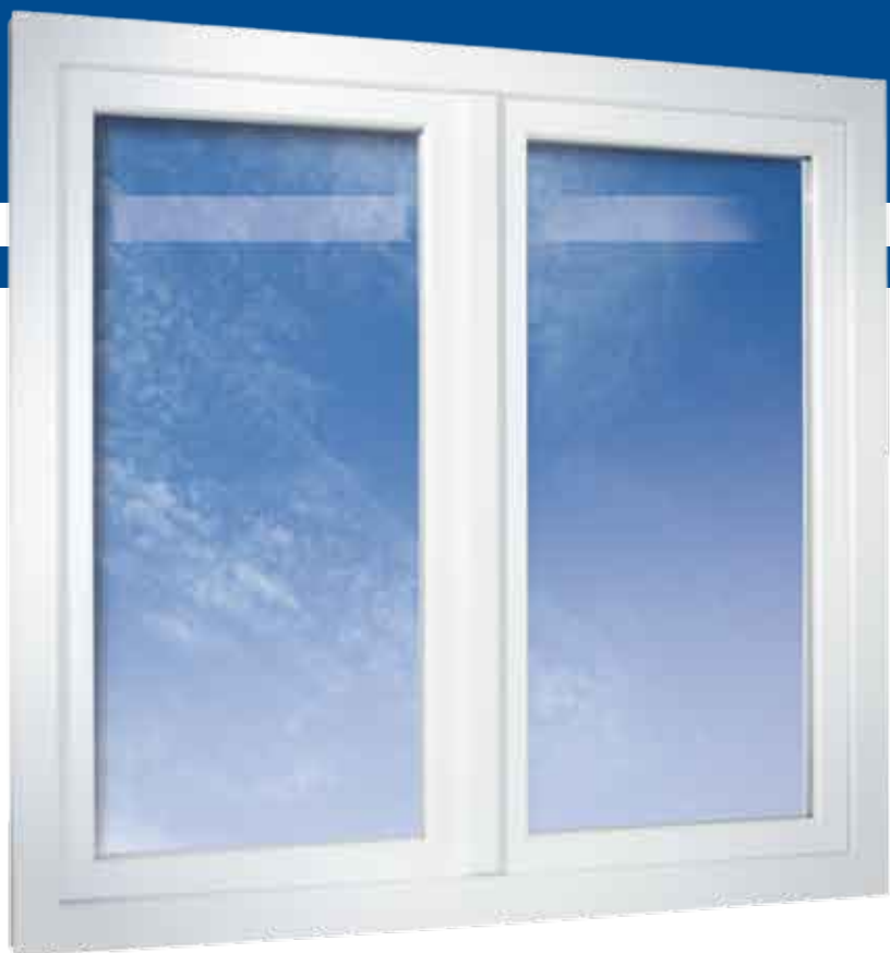
2-flügeliges Fenster flächenversetzt